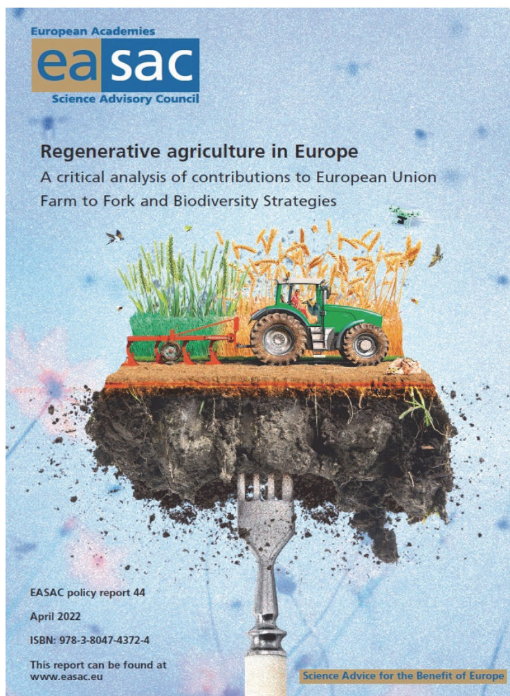
Ryc. 2. Raport dotyczący rolnictwa regeneracyjnego w Europie (EASAC, 2022) jest dostępny do pobrania na stronie https://easac.eu/publications/details/regenerative-agriculture-in-europe/

a także określono i przedyskutowano praktyki rolnicze stosowane najczęściej w rolnictwie regeneracyjnym. Dyskusja obejmowała krytyczne spojrzenie na trafność i zakres zdefiniowania wyzwań dla globalnego sektora żywnościowego, które zostały przedstawione w raporcie EASAC.