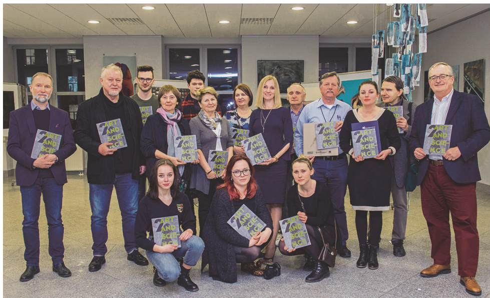
Ryc. 5. Prezentacja katalogu Sztuka bioróżnorodności czasie finisażu wystawy w Instytucie Nenckiego 19 grudnia 2018 r.

Jesienią 2018 roku rozpoczął się drugi projekt Art & Science „Sztuka Bioróżnorodności” („Art of Biodiversity”). Inicjatorami tego projektu był nie tylko Wydział Sztuki Uniwersytetu Rzeszowskiego oraz Instytut Nenckiego PAN, ale również Uniwersytet Artystyczny w Poznaniu, Instytut Filozofii Uniwersytetu Rzeszowskiego oraz Fundacja Marceliego Nenckiego Wspierania Nauk Biologicznych. Projekt został zrealizowany przy współpracy z Akademią Sztuki w Szczecinie, Wydziałem Sztuki Uniwersytetu Mikołaja Kopernika w Toruniu, Wydziałem Sztuki Uniwersytetu Marii Curie-Skłodowskiej w Lublinie oraz Wydziałem Artystycznym Uniwersytetu im. Kazimierza Pułaskiego w Radomiu.