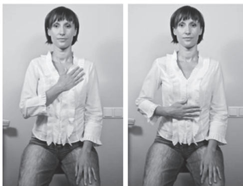
Ryc. 2. Zdjęcia aktorki wykonującej gest szczerości (po lewej) oraz gest kontrolny (po prawej) wykorzystane w badaniu 1. (Parzuchowski, Wojciszke, 2014)

W jednej z linii badawczych (Parzuchowski, Wojciszke, 2014) dowodziliśmy, że wykonanie metaforycznego gestu skutecznie wzbudza skojarzone z nim pojęcia i kształtuje przetwarzanie informacji społecznych na temat innych osób oraz samego siebie.