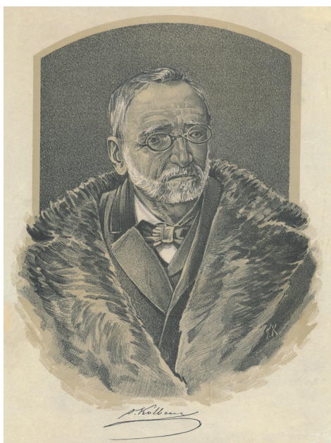
Ryc. 1. Oskar Kolberg. Litografia wykonana na podstawie rysunku Tadeusza Stachiewicza