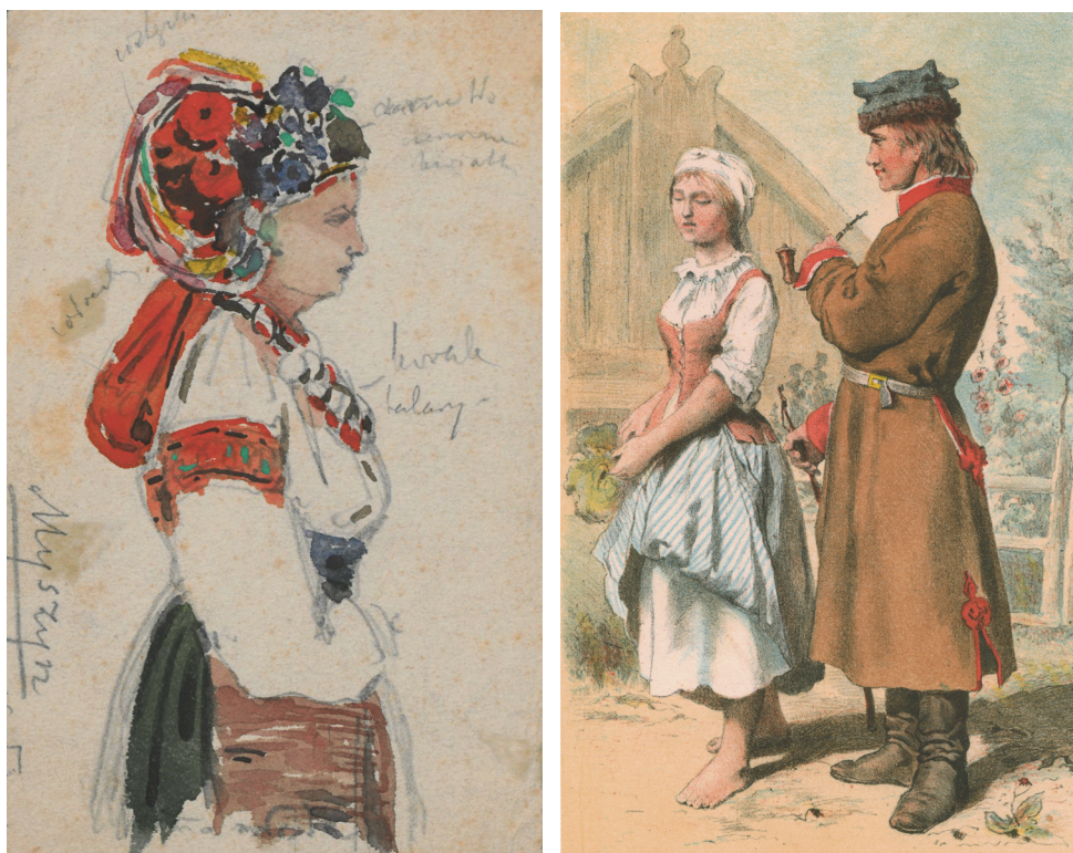
Ryc. 3. Rysunek nieznanego autora, Arch. PTL, teka 47, sygn. 1354/II i litografia wg akwareli Wojciecha Gersona zamieszczona w cz. II Lubelskiego (tom 17 Ludu )